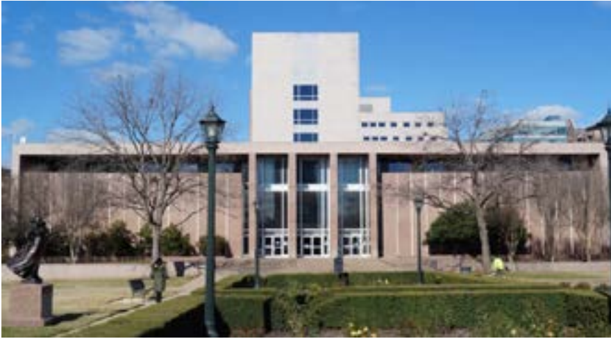
Mặt tiền Tòa án Tối cao Tiểu bang Texas

Vì lẽ ấy, không trừ ngoại lệ, đạo luật này đã gặp phải hết vụ kiện này đến vụ kiện khác và liệu nó có đứng vững hay không sẽ tùy thuộc vào hệ thống tòa án Texas khi nó tiến lên bậc thang phân cấp của tòa án.