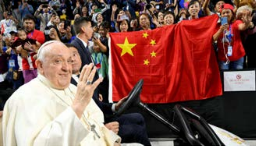
Giáo hoàng Phanxicô gặp các giáo dân dự thánh lễ tại thủ đô Ulan-Bator, Mông Cổ, ngày 03/09/2023.

bốn ngày, giáo hoàng không chỉ gặp gỡ một trong những cộng đồng Công giáo nhỏ nhất trên thế giới, mà còn gửi nhiều thông điệp trực tiếp tới Trung Quốc.