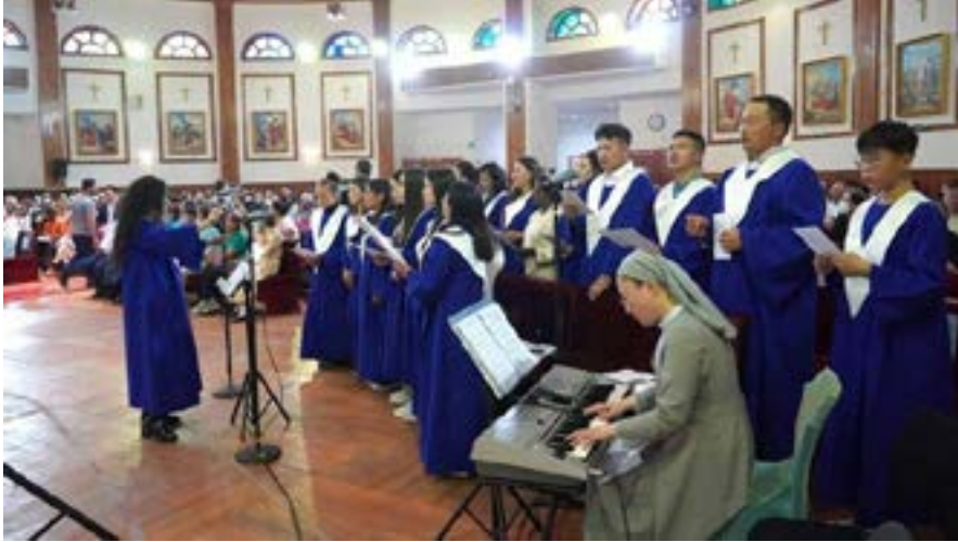
Hoạt động mục vụ tại Mông Cổ

Gần một phần ba các nhà truyền giáo hiện diện tại cộng đoàn Công Giáo nhỏ bé chào đón Đức Thánh Cha Phanxicô đến từ Hàn Quốc. Từ hoạt động phục vụ giáo dục của các nữ tu Dòng