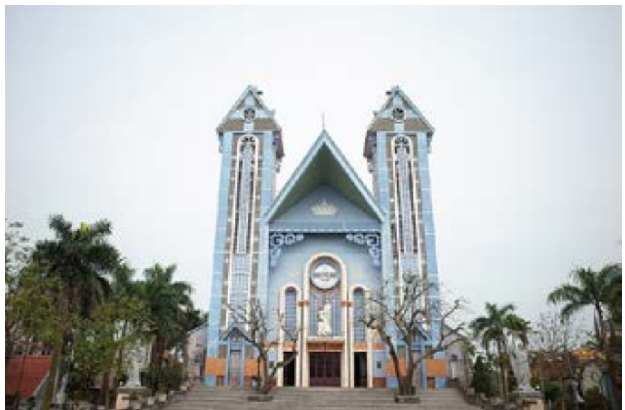
Nhà thờ GX. Tử Nê, nơi lưu trữ Hài cốt Thánh nhân