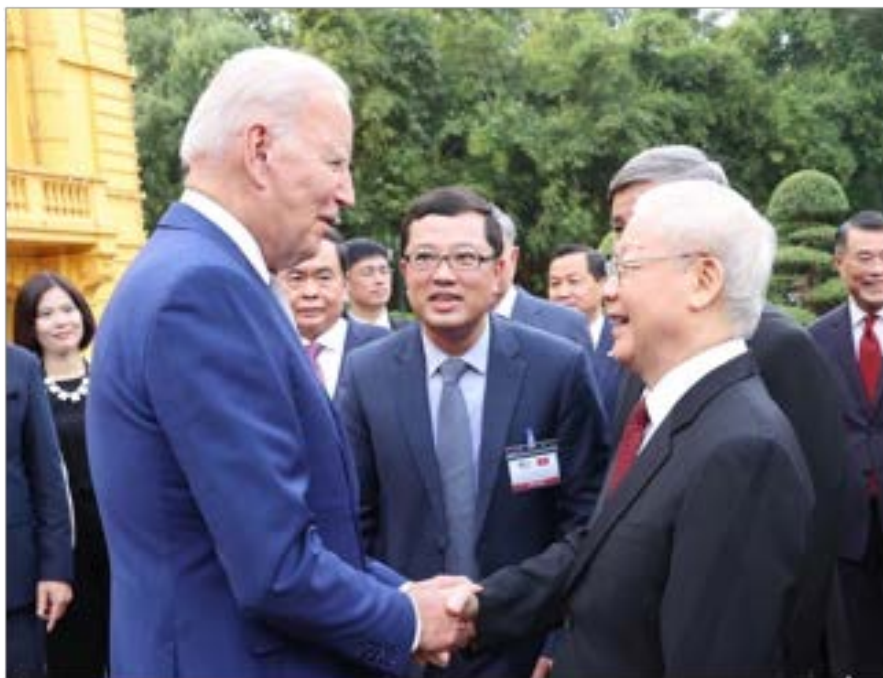
Tổng Bí Thư Nguyễn Phú Trọng đón tiếp Tổng Thống Joe Biden 10-9-23

Nghe cụm từ “Đối tác chiến lược toàn diện” (liên hệ ngoại giao ở cấp cao nhất) nhiều người tưởng lầm đó là sự cộng tác chặt chẽ về mọi lãnh vực, cả chính trị lẫn quân sự. Chữ kép “Chiến lược” nặng mùi quân sự hơn kinh tế. Nếu đúng như vậy thì Việt Nam đã ngã hẳn sang Mỹ và quay mặt với Trung Quốc rồi. Thực tế, Ông Trọng chỉ nói tới hợp tác và phát triển kinh tế có lợi cho Việt Nam, ông Biden hoan