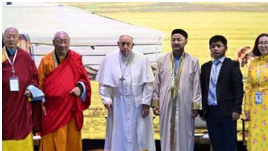
Giáo hoàng Phanxicô (giữa) trong cuộc gặp liên tôn giáo ở Ulan-Bator, Mông Cổ, ngày 03/09/2023.