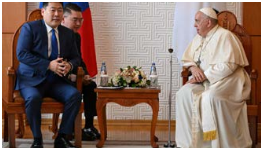
Thủ tướng Mông Cổ Luvsannamsrai Oyun-Erdene tiếp giáo hoàng Phanxicô tại thủ đô Ulan-Bator, ngày 02/09/2023.

Theo AFP, trong bài phát biểu sáng nay, giáo hoàng cũng lên án nạn tham nhũng tại quốc gia này. Một vụ bê bối tham nhũng mới đây trong ngành khai mỏ Mông Cổ đã làm dấy lên hàng loạt cuộc biểu tình phản kháng hồi tháng 12/2022. Ngài kêu gọi « hành động khẩn cấp và mạnh mẽ để bảo vệ Trái đất, ngôi nhà chung », cũng như làm nhiều hơn nữa để bảo vệ môi trường tại Mông Cổ, một trong những quốc gia xuất khẩu than đá nhiều nhất thế giới.