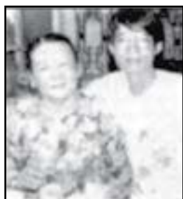
Nữ Chủ Nhân Phở Tàu Bay Lý Thái Tổ Sài Gòn và Nghĩa Từ Phở Tàu Bay Santa Ana, Cali

3610 W. First St. Suite C, Santa Ana, CA 92703