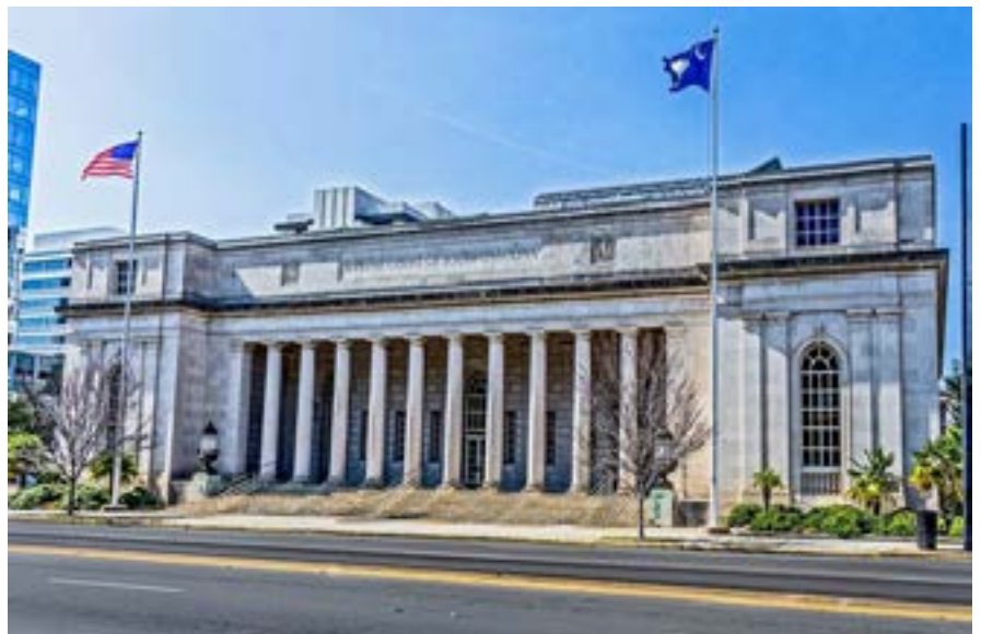
Tiền đình Tòa án Tối cao TB South Carolina – Trên Google

The court ruled 4-1 that South Carolina’s constitutional protection against “unreasonable invasions of privacy” does not extend to abortion and that the state statute was “within the zone of reasonable policy decisions rationally related to the