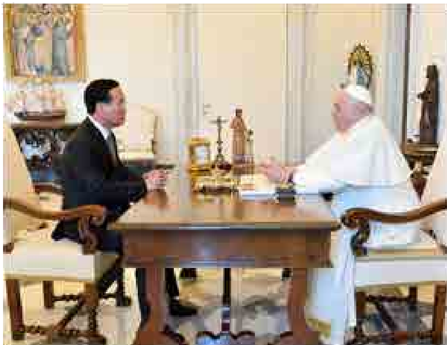
Đức Giáo Hoàng tiếp Chủ Tịch Võ Văn Thưởng

“Nhân dịp Chủ Tịch Nước Võ Văn Thưởng của Việt Nam thăm Tòa Thánh Vatican ngày 27-7-2023, dựa trên căn bản đợt làm việc thứ 10 của nhóm hỗn hợp giữa Việt Nam và Tòa Thánh hôm 31-3 tại Vatican, và với mong muốn gia tăng quan hệ song phương, hai bên chính thức thông báo rằng chính quyền Việt Nam và Tòa Thánh kết luận “Đồng ý quy chế của Văn Phòng Thường Trục Tòa Thánh tại Việt Nam” (Reuters).