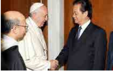
Ngày 19/10/2014, Thủ tướng Nguyễn Tấn Dũng hội kiến với Đức Giáo hoàng Phanxicô