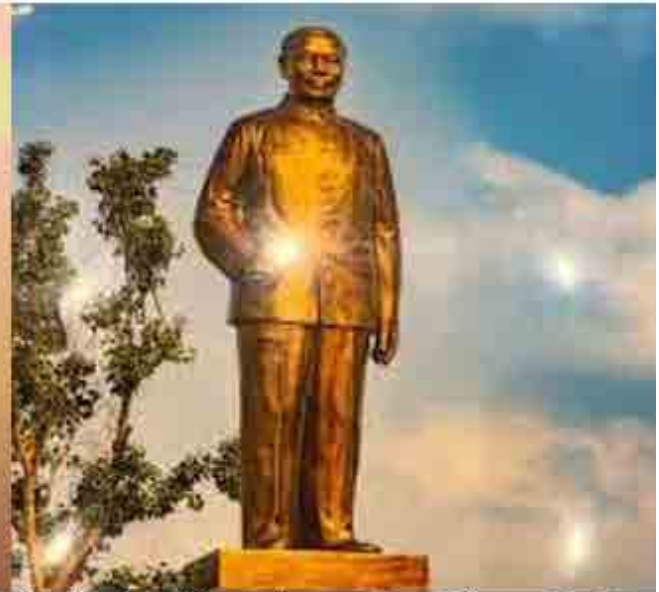
Tình thương non nước bao la/ Năm châu vô sản chan hòa anh em. Sóng Hồng – Trường Chinh (09/02/1907 – 30/09/1998)