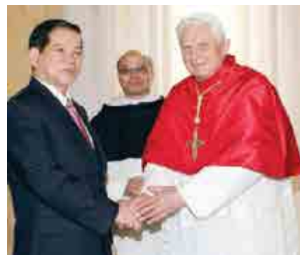
Cụ thể, ngày 12/12/2009 Đức Giáo hoàng Benedict XVI tiếp Chủ tịch nước Nguyễn Minh Triết tại Vatican