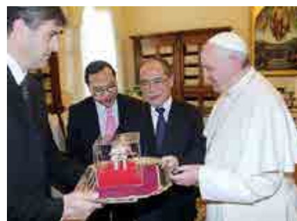
Nhân chuyến thăm chính thức Cộng hòa Italy, chiều 22/3/2014, Chủ tịch Quốc hội Nguyễn Sinh Hùng đã có cuộc hội kiến với Đức Thánh Cha Phanxicô cùng quý chức lãnh đạo Tòa thánh Vatican.

Chủ tịch nước Võ Văn Thưởng và phu nhân trong cuộc gặp Đức Giáo hoàng Phanxicô chiều 27-7-2023