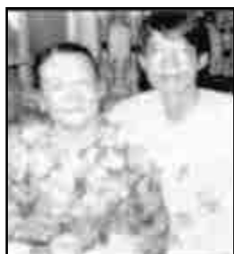
Nữ Chủ Nhân Phở Tàu Bay Lý Thái Tổ Sài Gòn và Nghĩa Từ Phở Tàu Bay Santa Ana, Cali

3610 W. First St. Suite C, Santa Ana, CA 92703