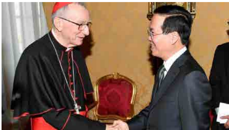
Đức Hồng y Quốc vụ khanh Tòa Thánh Pietro Parolin và Chủ tịch nước Việt Nam Võ Văn Thương

Thưa Đức Hồng Y, trong các thông cáo báo chí khác nhau trước kết quả ngày hôm nay, người ta luôn đề cập đến một hành trình dài được đánh dấu bằng sự tôn trọng và thảo luận chân thành. Ngài mô tả hành trình này như thế nào?