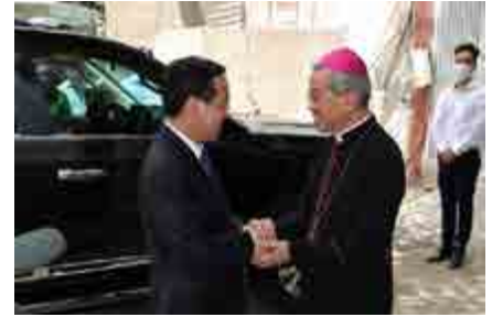
Đức Tổng Giám mục Nguyễn Năng – Chủ tịch Hội đồng Giám mục Việt Nam chào đón Chủ tịch nước Võ Văn Thưởng

Một dấu chỉ mới đặc biệt cho thấy thiện chí của phía Nhà nước Cộng sản Việt Nam đối với Công giáo ngay sau chuyến công du sang Ý của ông cùng với cuộc gặp gỡ tại Vatican giữa ĐTC Phanxicô với Chủ tịch Nước Võ Văn Thưởng ngày 27/7/2023.