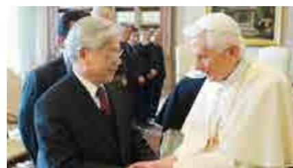
Ngày 22/1/2013, ĐGH Bênêđictô XVI tiếp Tổng bí thư đảng CSVN Nguyễn Phú Trọng tại Vatican,