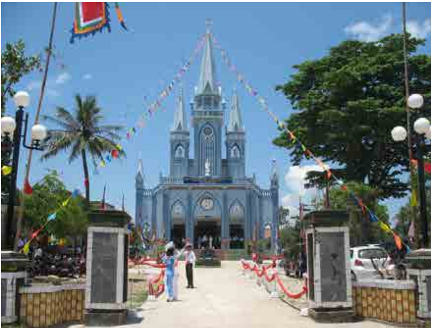
Nhà thờ Giáo xứ Kê Văn Giáo hạt Quảng Trị, Tổng Giáo Phận Huế