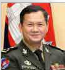
Hun Manet vừa được cha truyền ngôi thủ tướng

Thời vua chúa cha truyền con nối Thời độc tài con nổi cha truyền Làm cho trăm họ phải yên Chọn bầu rắc rối, tranh quyền lời thối Hun Sen vốn theo đuôi Khmer đỏ Giết dân Miên máu đổ thành sông Đến khi thấy chuyện không xong Chạy theo Việt Cộng tấn công gà nhà Được chủ mới đưa ra quảng cáo Nặng cho thành lãnh đạo phường chèo Lúc đầu ra lệnh là theo Thời cơ gặp vận qua vèo Anh Hai Nhờ quốc tế, canh bài tàn cuộc Lính Việt Nam phải buộc rút về Hun Sen vùng vẫy thỏa thuê Giả vờ dân chủ, mọi bề đẹp tươi Rồi từng bước diệt người đối lập Bỏ Anh Hai, bám chặt Anh Ba Anh Ba có lắm Đô-la Anh Hai kiệt lộ, ba hoa thì tài 38 năm ngồi ngai thủ tướng Chẳng nhường ai, tự sướng một mình Lo cho cậu cả thành danh Cho sang Mỹ học về hành dân Miên Nay Manet thành niên tốt tướng Cha nhường ngôi mới sướng làm sao! “Vì nhân dân” ở chỗ nào? Cùng lò công sản chui vào, giống y!