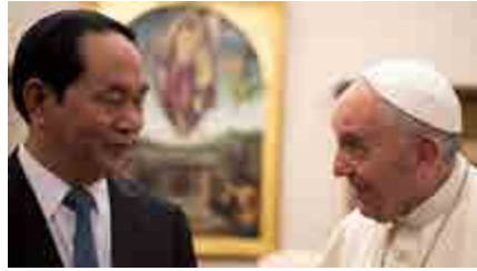
Ngày 23/11/2016 Đức Giáo Hoàng Phanxicô tiếp Chủ tịch nước Trần Đại Quang tại Vatican