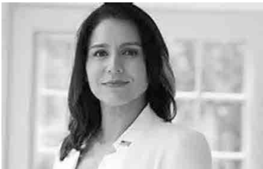
Chân dung Tulsi Gabbard