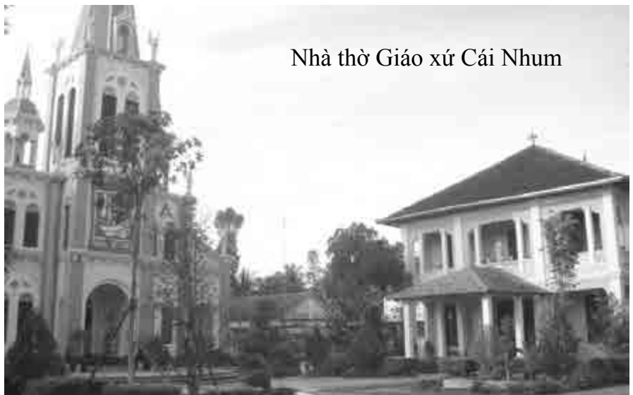
Nhà thờ Giáo xứ Cái Nhum

Đức Piô X đã suy tôn ông Trùm Giuse Nguyễn Văn Lựu lên bậc chân phước Ngày 02-05-1909. Ngày 19-06-1988, Đức Gioan Phaolô II suy tôn ngài lên bậc Hiển thánh.