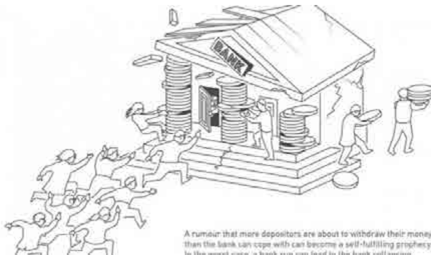
A rumour that more depositors are about to withdraw their money than the bank can cope with can become a self-fulfilling prophecy. In the worst case, a bank can even fail to the bank will become.

NHNN nhìn nhận, cuộc hoảng loạn khởi đầu từ hàng loạt thông tin tiêu cực về ngân hàng SCB đã xuất hiện trên mạng xã hội từ sáng sớm hôm 07 tháng