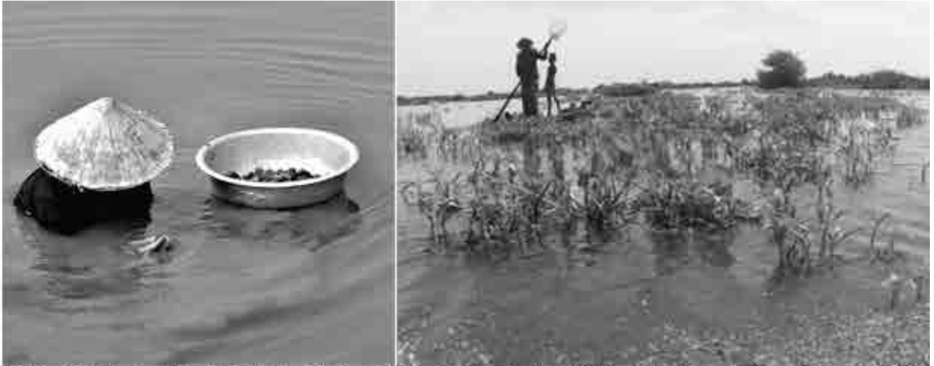
Trái: Mò ốc ở QB. Ảnh Thiện Nhiên 2020. Phải: vớt ốc ở Biên Hồ, Cambodia. Ảnh tnt 2019