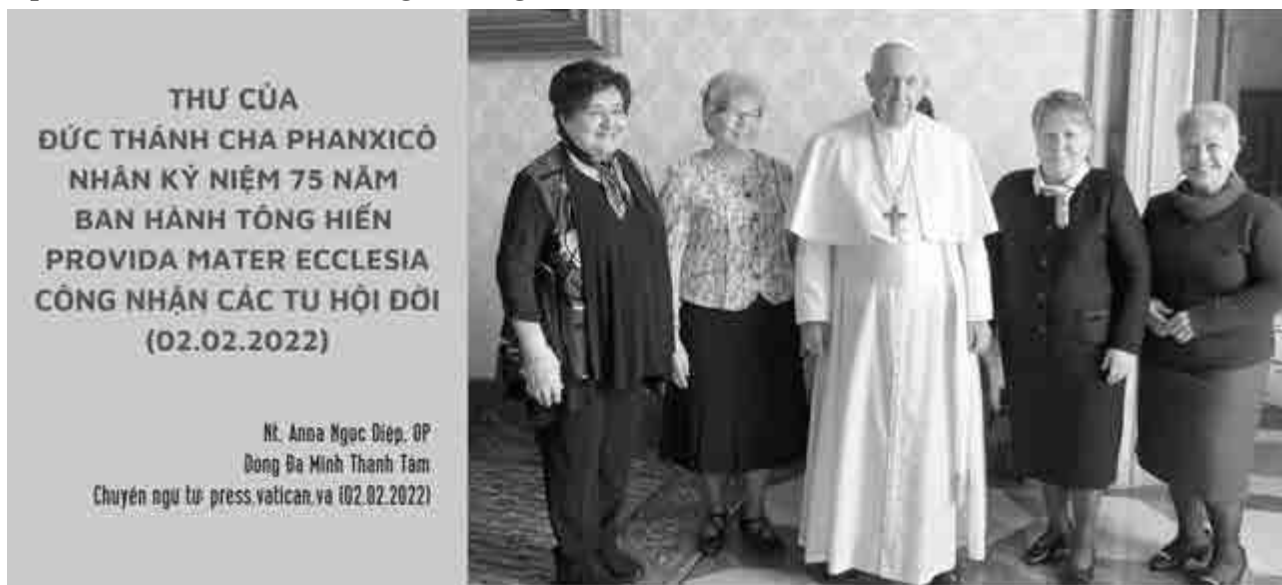
Đức Thánh cha và các đại diện của Hội nghị Thế giới về các Tu hội đời, ngày 02.02.2022