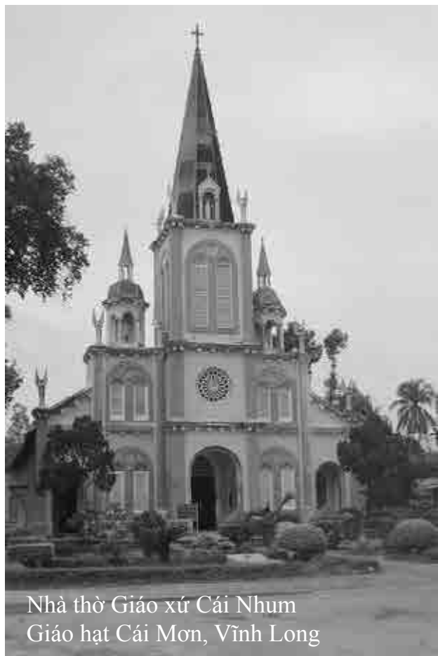
Nhà thờ Giáo xứ Cái Nhum Giáo hạt Cái Môn, Vĩnh Long

- Nay : Thuộc xã Long Thới, huyện Chợ Lách, tỉnh Bến Tre.