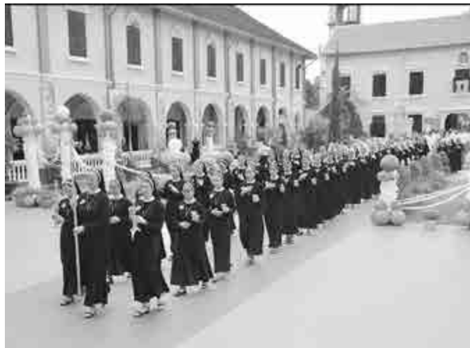
Dòng Mến Thánh Giá Cai Mon

bị giải về tỉnh Vĩnh Long. Ông qua đời trong tù đêm 02 tháng 5 năm 1854, an táng trong nền nhà thờ của họ Mạc Bắc.