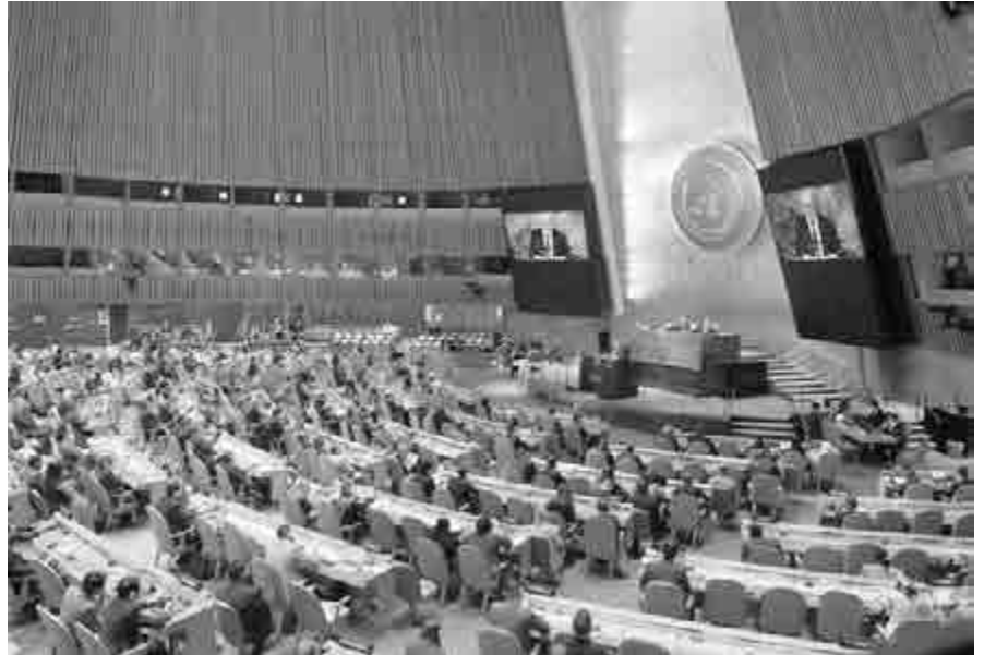
Đại Hội Đồng Liên Hiệp Quốc họp khóa tháng 10/2022

T rên nguyên tắc, Liên Hiệp Quốc là tổ chức toàn cầu có nhiệm vụ duy trì hòa bình và trật tự trên thế giới, đồng thời bảo vệ quyền được sống trong tự do và nhân phẩm của toàn thể mọi người trên địa cầu. Những nguyên tắc trên thật tuyệt vời, có thể nói là có giá trị thiêng liêng đối với cộng đồng nhân loại. Điều đáng buồn là LHQ không thực hiện được sứ mệnh, chỉ trong tháng 10/2022 vừa qua, tổ chức này đã tỏ ra bất lực và làm trò cười cho thiên hạ qua hai việc