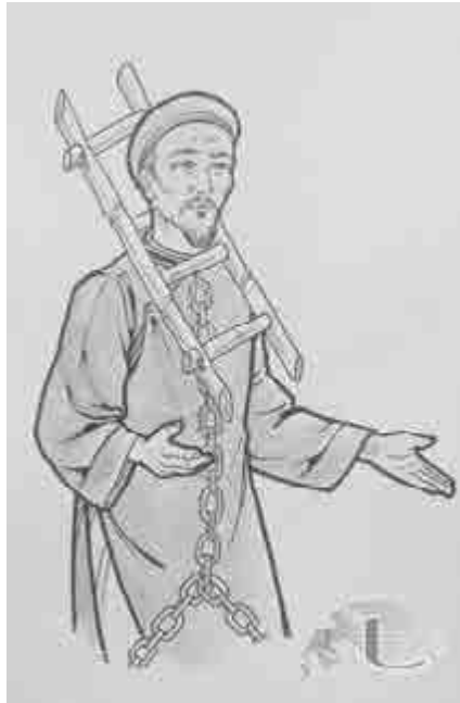
Cực hình: Gông cùm tới chết

Những hình khổ trong tù đã làm bốn người thối chí, họ muốn sống dễ dãi hơn. Những người yếu lòng ấy không chỉ phản bội Thiên Chúa họ còn đổ tội cho ông trùm Mạc Bắc là người tiếp đón và cho đạo trưởng trú ẩn. Họ nguyện rửa ông như là người gây ra mọi tang tóc, mọi khổ cực của họ. Riêng ông trùm Lựu, trước sau vẫn một mực trung kiên với Thiên Chúa, ông đón nhận những lời sỉ nhục và mọi đau khổ một cách khiêm tốn để đền bù những tội lỗi mình. Ông sẵn sàng đón nhận tất cả vì ông tin tưởng vào Thiên Chúa. Tín thác hoàn toàn nơi Ngài, lời tâm sự cùng linh mục cùng bị giam cho thấy ông có một niềm tin vững mạnh và tấm lòng hy sinh cao cả : “Thưa cha, xin